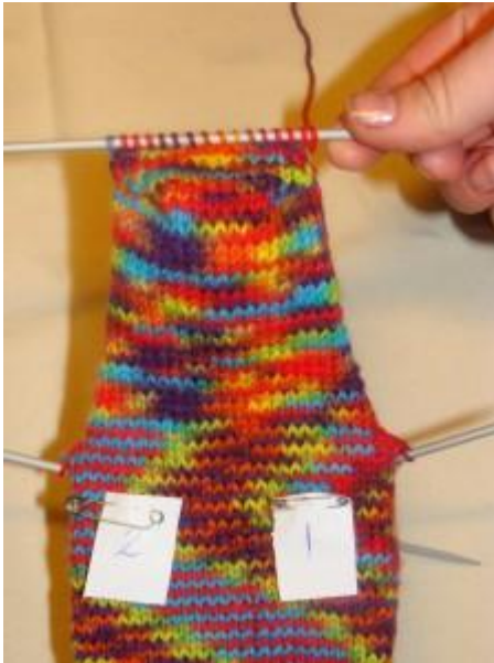
den færdige hællap og hælbund

Gentag pind 3 og 4 indtil alle masker er strikket med.