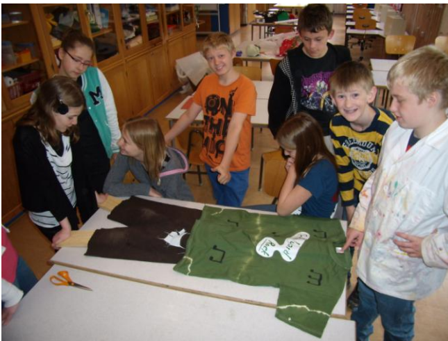
Tøjet prøves på skelettet.