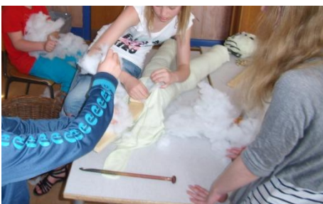
Nogle river mere fyld mens andre stopper det i dukken.