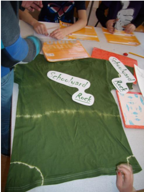
T-shirten er batikfarvet.