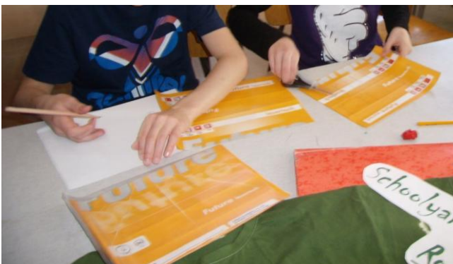
Der tegnes noder på stencil til efterfølgende tryk.