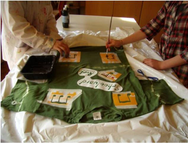
Noder males på T-shirten.