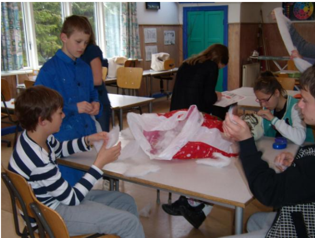
Fyld til dukken rives i mindre stykker. Der skulle bruges meget fyld.