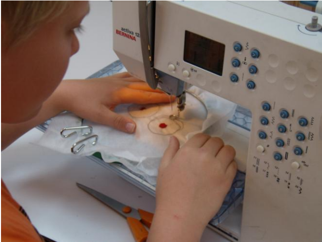
Øjne, mund og næse er lavet som frit maskinbroderi på solvy (vandopløseligt materiale). Derefter er de syet på hovedet.