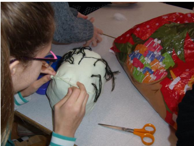
Der sys hår på hovedet.