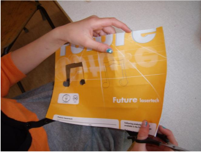
Stencil klippes ud.