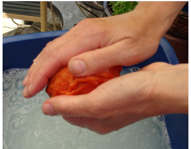
7. Derefter mere hårdhændet.