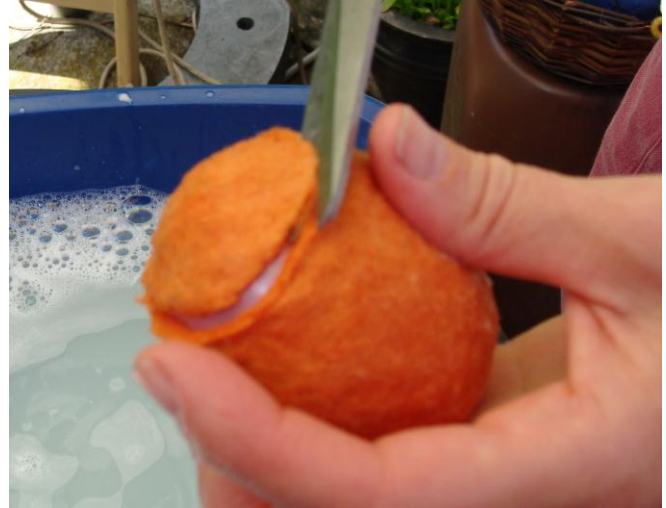
8. Når filtningen er færdig, klippes et lille hul i den ene ende.