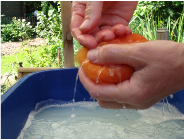
5. Nu starter vådfiltningen