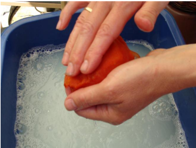
6. Først forsigtigt.